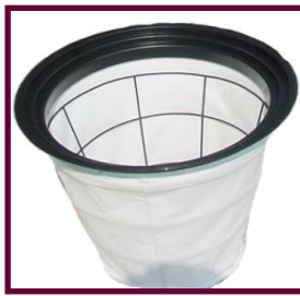
กรองฟิลเตอร์ เป็นโพลีเอสเตอร์